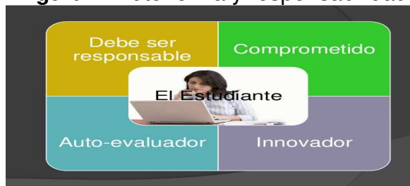
Figura 4. Autonomía y responsabilidad